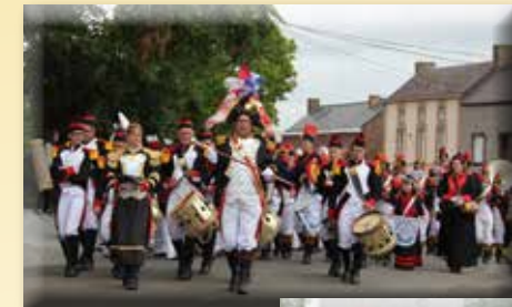
Tamboers, pijpen en muziek

De “vrijwilligers van de Brabantse Revolutie” uit Ham-sur-Heure nemen al 50 jaar deel.