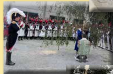
De belofte van de heer van Walcourt aan de Heilige Maagd in Jardinet