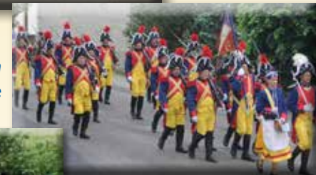
Elite-eenheid van de Gendarmerie